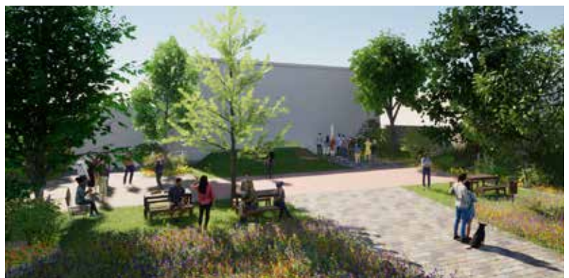
Visuel non contractuel : le rendu final est susceptible d'évoluer

Une attention particulière sera portée à la gestion durable des eaux pluviales et à la réutilisation des matériaux issus du chantier, afin de limiter l'empreinte environnementale du projet. Le montant total de l'opération est estimé à 90 065 €, avec une possibilité de subvention pouvant atteindre 40 000 €. Deux entreprises interviendront sur le site : l'une pour les travaux de voirie, l'autre pour les aménagements paysagers et le mobilier urbain.